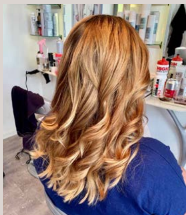
Lavet af Michala Høgh fra Allé salonen/Styleexpert