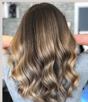
Lavet af Michella Storgaard Knudsen fra Salon Fritz