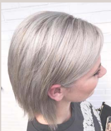
Lavet af Stella Maren Sørensen fra Style Garage